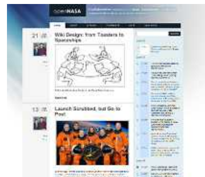
NASA “Open NASA”

米国航空宇宙局（NASA）の 30 歳以下の職員の割合はわずか 4 %。若者の NASA に対する関心度も低下しつつあります。これからの社会における、NASA の存在意義に関する認識を高めるために、ソーシャル・メディアを利用して、ミレニアルズ世代とのコミュニケーションを積極的に展開しています。「宇宙から Twitter」など、話題性のある企画を展開。